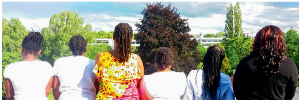
Alltagslotsinnen des Peer-to-Peer-Projektes